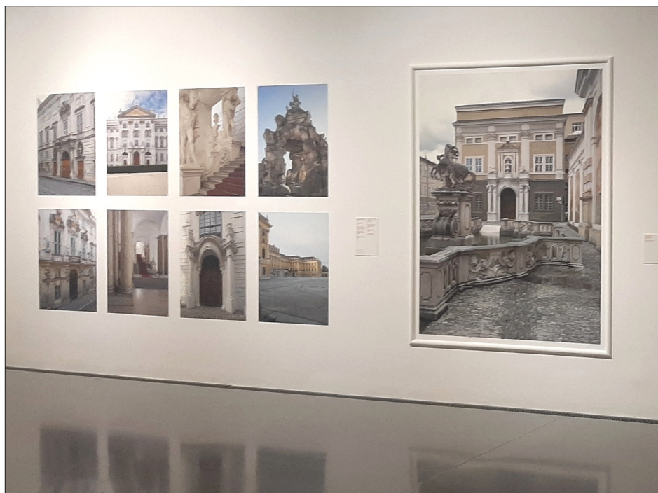
8. Fragment ekspozycji, fot. autor, 2023