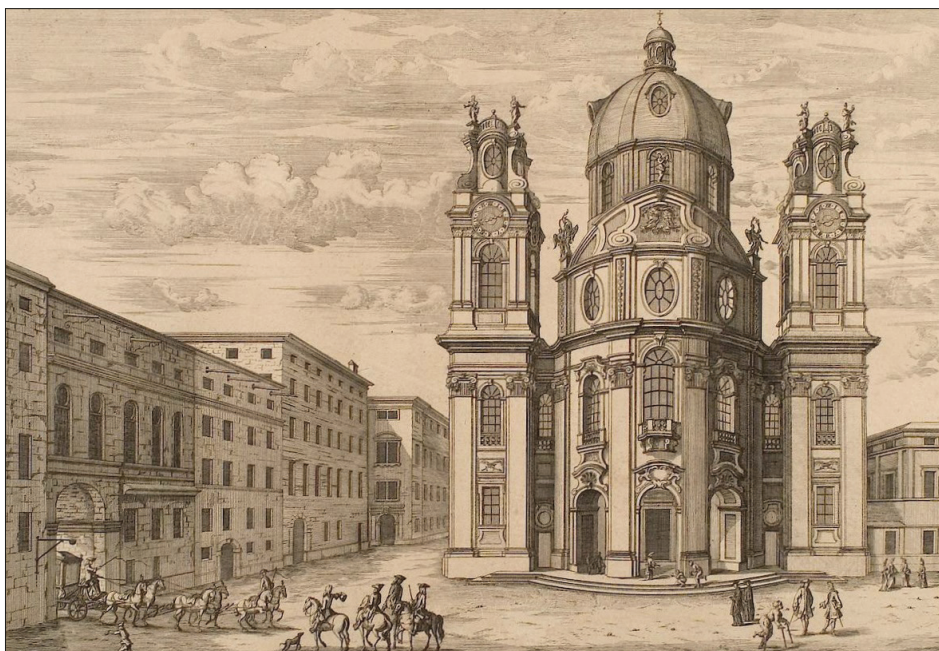
3. Kolegiata w Salzburgu, ilustracja z traktatu: Entwurf einer historischen Architectur , Leipzig 1725, t. IV