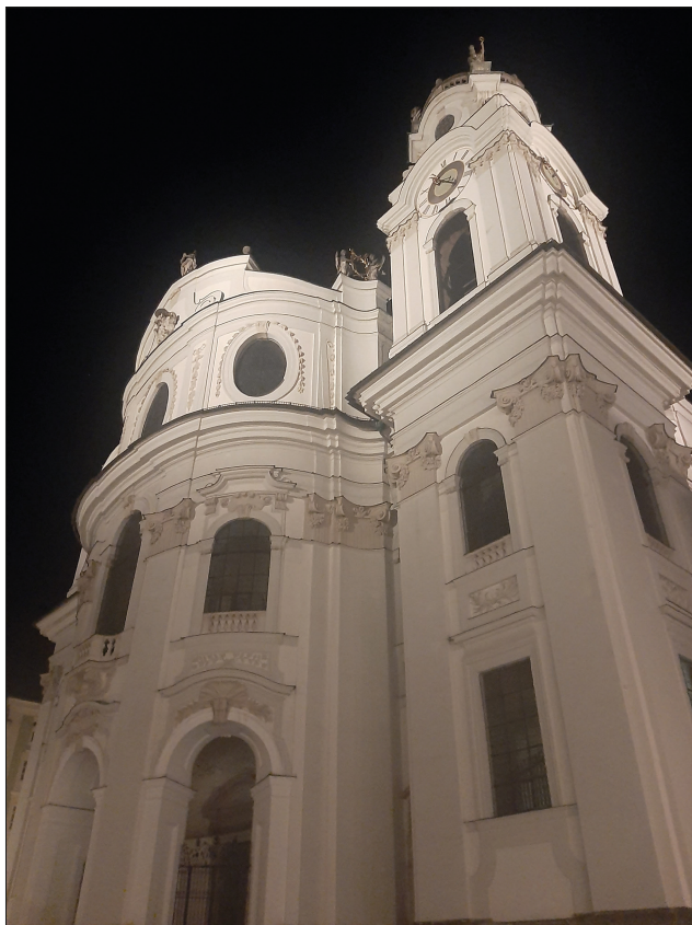
4. Kolegiata w Salzburgu, fot. autor, 2023