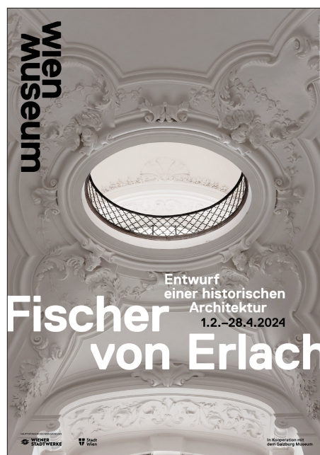
10. Plakat wystawy w Muzeum Wiednia