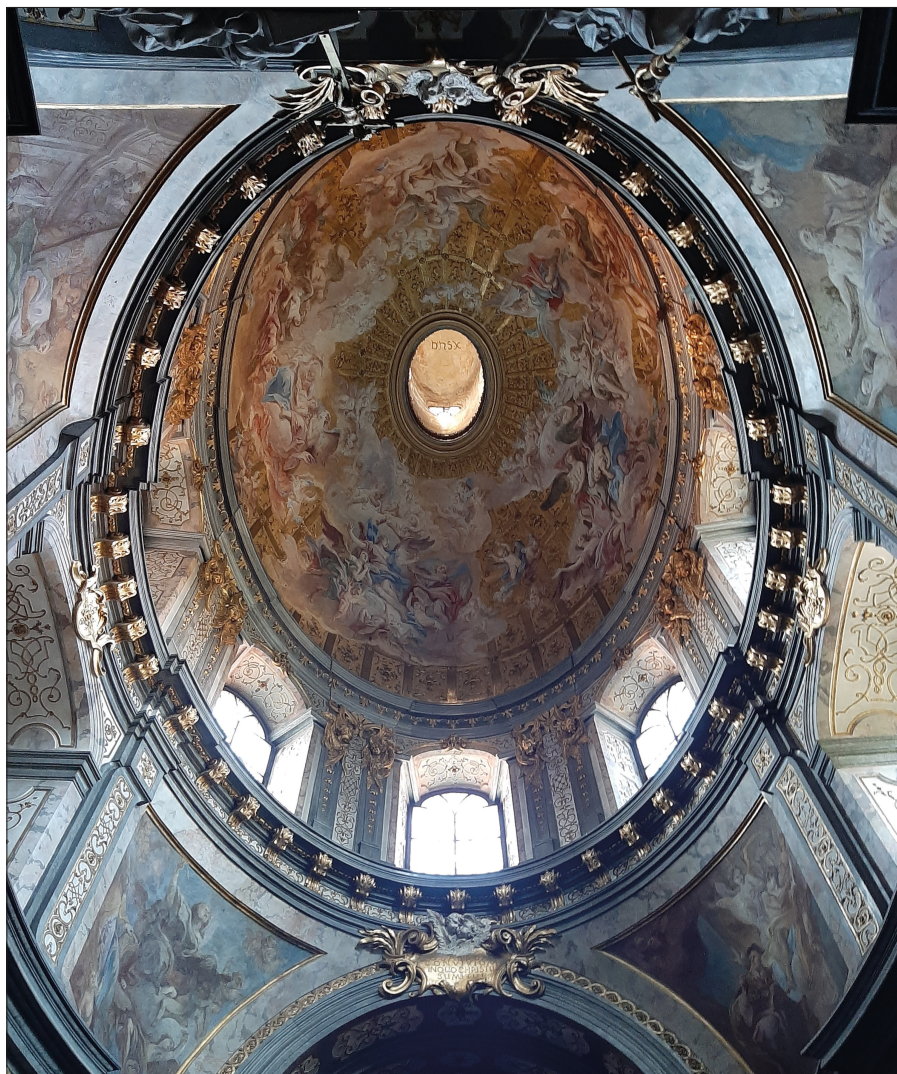
1. Katedra we Wrocławiu – kopuła w kaplicy elektorskiej, fot. autor, 2022

kolegiatę i klasztor urszulanek 2 . Stąd w pełni zrozumiałe jest, że to właśnie Salzburg podjął się organizacji wystawy, której kuratorami zostali mgr Peter Husty oraz wiedeńczyk dr Andreas Nierhaus [il. 5].