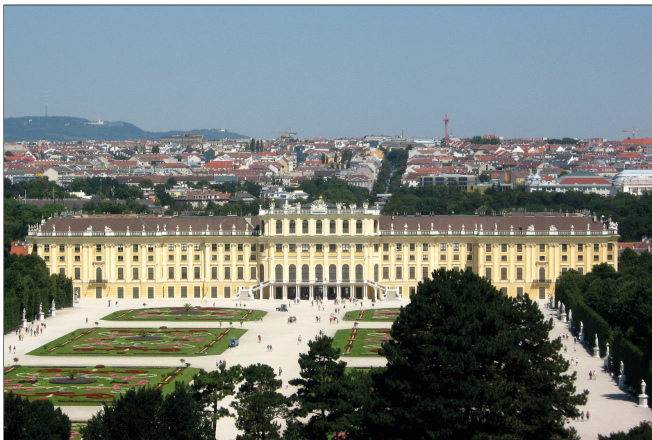
2. Założenie rezydencjonalne Schönbrunn w Wiedniu, fot. autor, 2016