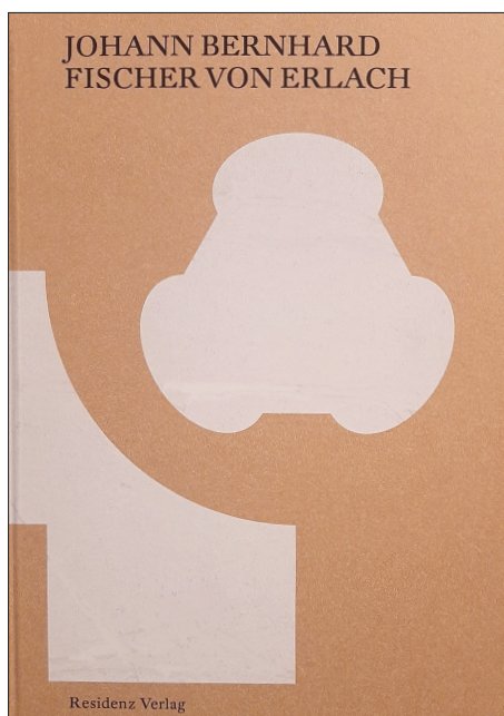
9. Okładka katalogu wystawy, fot. domena publiczna