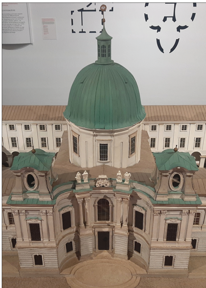
7. Model kościoła Świętej Trójcy w Salzburgu (prezentowany na wystawie), fot. autor, 2023