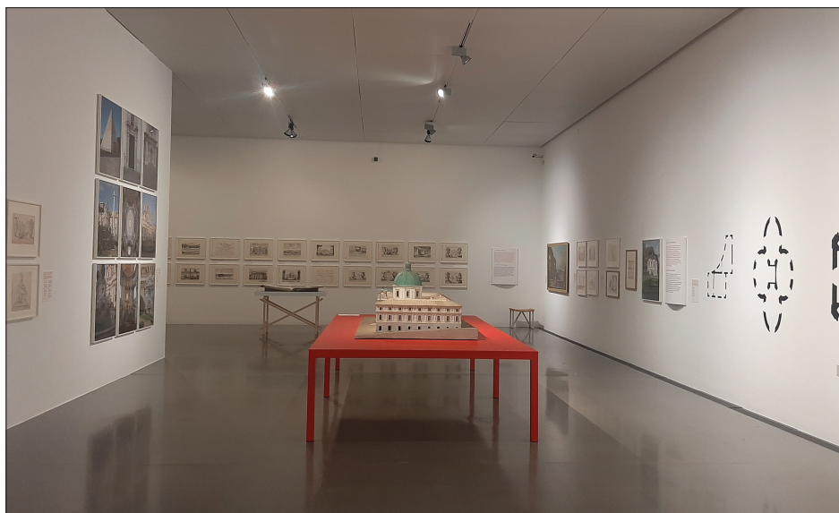
5. Wystawa poświęcona Fischerowi von Erlach – fragment ekspozycji, fot. autor, 2023