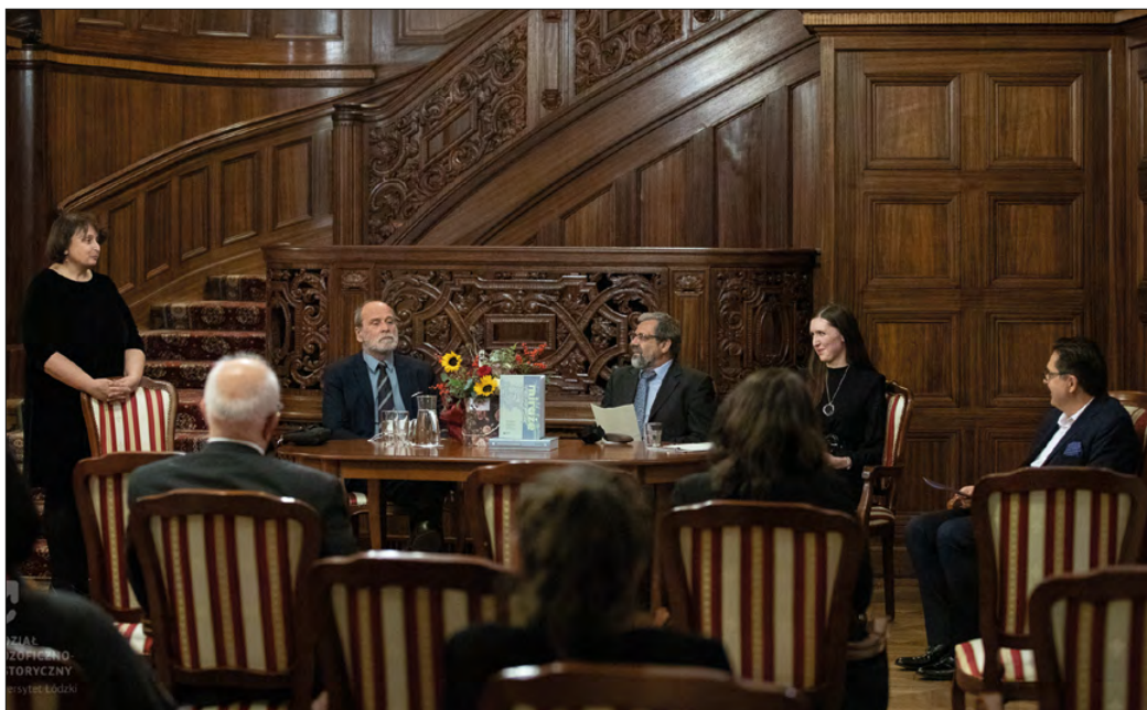
4. | Uroczystość wręczenia Festschriftu, fot. B. Kałużny, 2021