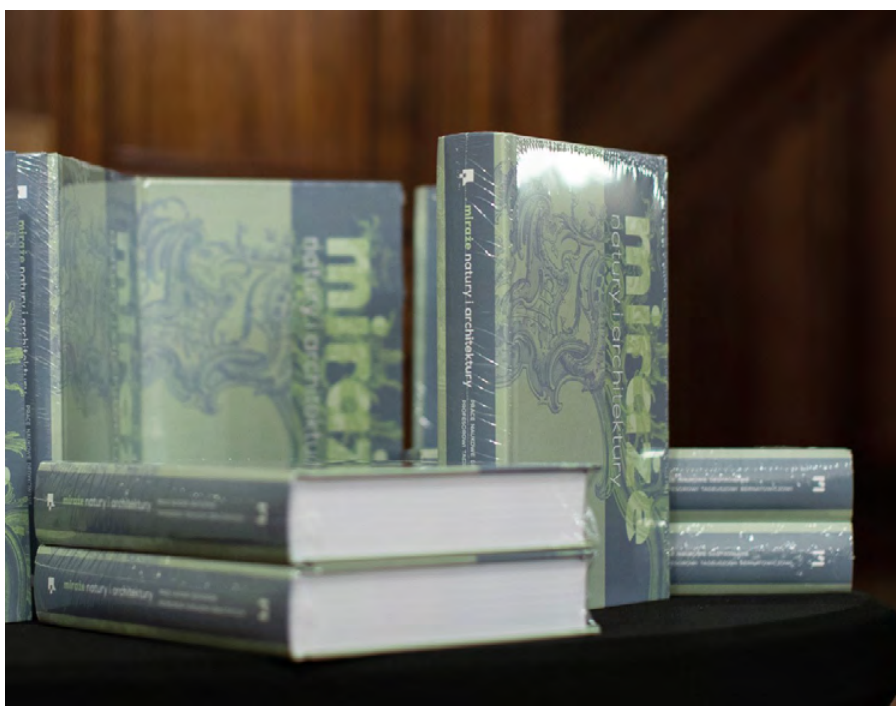
5. | Egzemplarze monografii Miraże natury i architektury. Prace naukowe dedykowane Profesorowi Tadeuszowi Bernatowiczowi , red. A. Barczyk, P. Gryglewski, Łódź 2021, fot. B. Kałużny, 2021