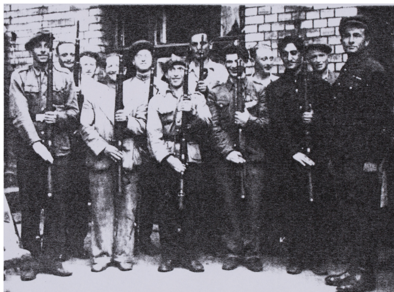
Ryc. 2. Straż Wojewódzkiego Komitetu Żydowskiego we Wrocławiu

Dolnego Śląska oraz Olsztynie, Bydgoszczy, Szczecinie i Gdańsku. Utworzenie Komisji spełniło swoje zadanie – przeprowadzono ok. 2 tys. interwencji; najtrudniejsze w: Białymstoku, Bielawie, Bytomiu, Krakowie, Legnicy, Otwocku, Rychbachu (Dzierżoniowie) i Szczecinie (do strzelaniny doszło w: Rabce i Białymstoku). Wydaje się, że cenne dla lepszego zrozumienia struktury terenowej oraz warunków powstania, działalności i likwidacji poszczególnych Komisji Specjalnych byłoby nakreślenie tła w postaci powojennych skupisk żydowskich – ich liczebności i rozmieszczenia. Wyjaśniłoby to, dlaczego formacjom na Dolnym Śląsku (powołanym nawet w bardzo małych miastach) autorka poświęciła relatywnie najwięcej rozważań.