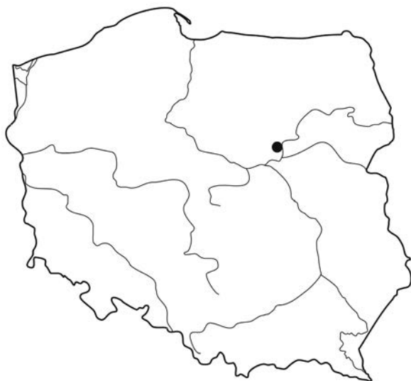
Ryc. 1. Brązowe siekierki z okolic Pułtuska – lokalizacja

Siekierki tego typu, w obydwu wariantach, datowane są na fazę Br B (Blajer 1990, s. 23, 24, 1999, s. 22, 2001, s. 78, 79; Szpunar 1987, s. 51–55), a głównym obszarem ich występowania są zachodnie tereny ziem polskich: Pomorze Zachodnie (głównie wariant B), Ziemia Lubuska i Wielkopolska (Blajer 2001, s. 79; Bukowski 1998, s. 119; Szpunar 1987, Taf. 36).