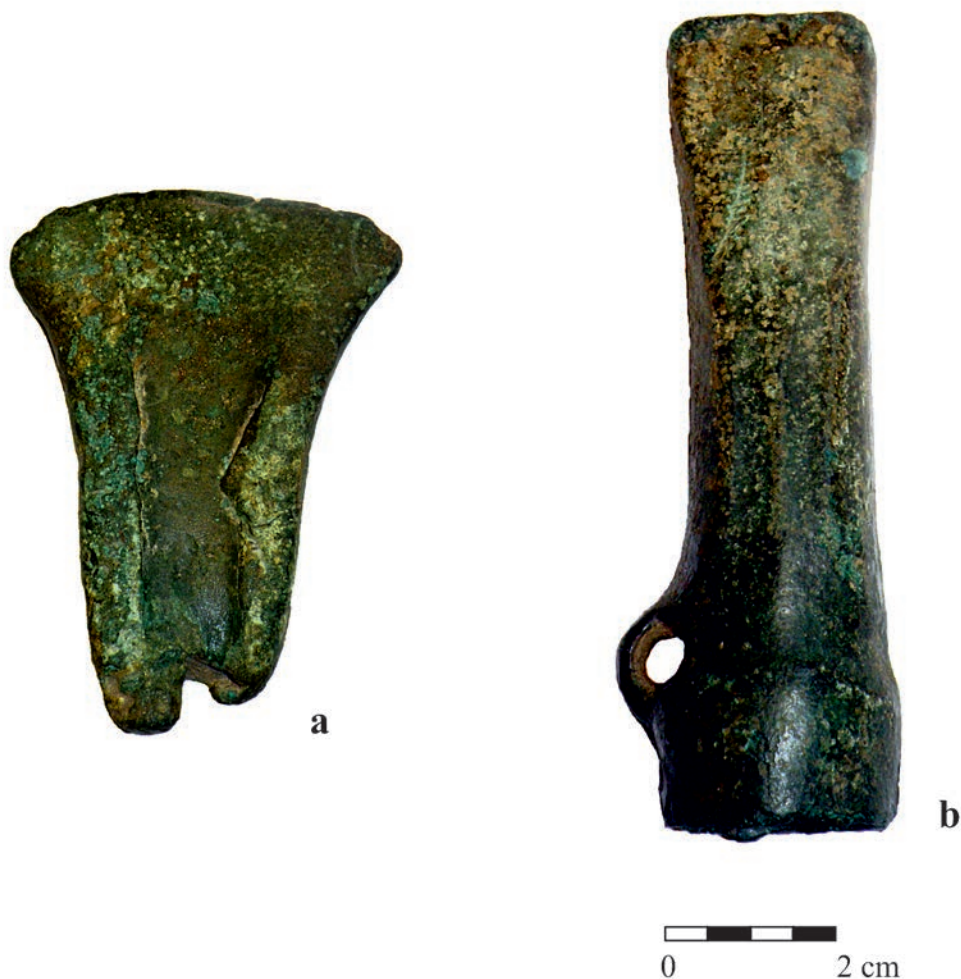
Foto. 1. Brązowe siekierki z okolic Pułtuska, gm. loco, woj. mazowieckie. a – siekierka z brzegami; b – siekierka z tulejką

pu siekierki występują na terenach Wielkopolski i Dolnego Śląska, gdzie są składową inwentaryzacji depozytów związanych z kulturą łużycką, datowanych na HaB 1 –HaB 2 /HaB 3 (Kaczmarek 2002, s. 98; Kuśnierz 1998, s. 43).